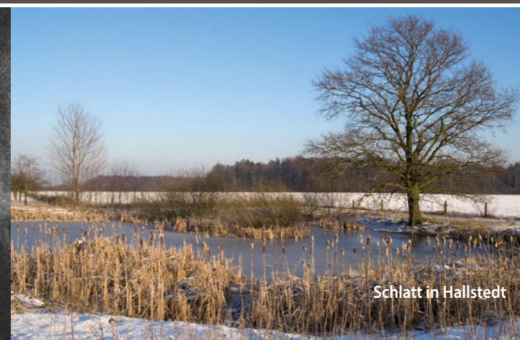
Schlatt in Hallstedt