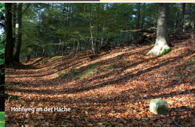
Hohlweg an der Hache