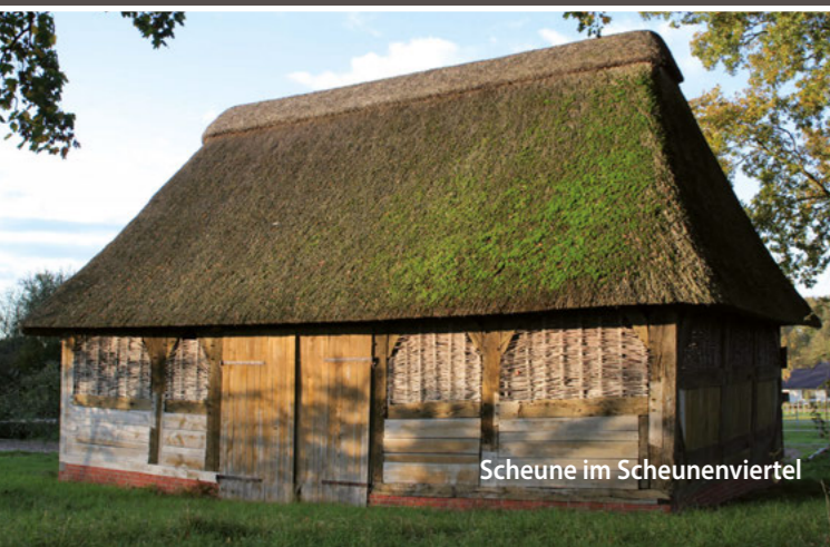
Scheune im Scheunenviertel

Er wurde mit Tischen und Stühlen bestückt. Hinzu kam ein Lehmbackofen, der mit Butterkuchen, Flammkuchen und Brot auf den Dorffesten die Gäste kulinarisch verwöhnt. Vor allem im Sommer machen hier viele Ausflügler Station, um zu verschlafen und zu picknicken.